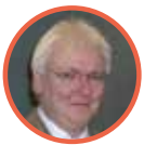
Klaus Feuerhelm Regierungspräsidium Tübingen