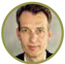
Dr. Björn Wiese Janssen Cilag